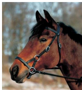
Hackamore och Sidepull