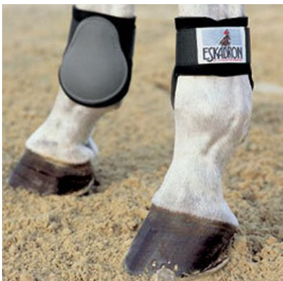
BAKSKYDD (används på bakbenen)