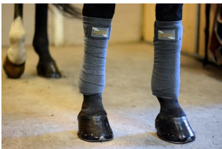
LINDOR (kan användas på både fram och bakbenen)