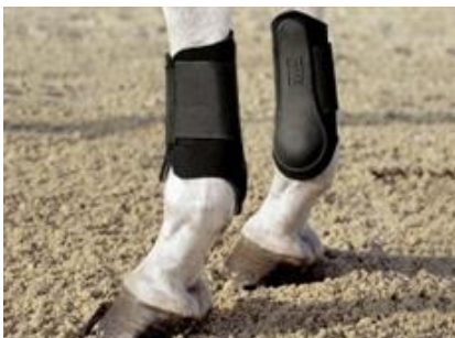
STRYKKAPPOR (kan användas på både fram och bakbenen)