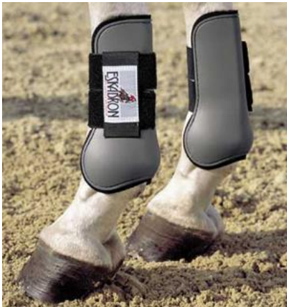
SENSKYDD (används på frambenen)